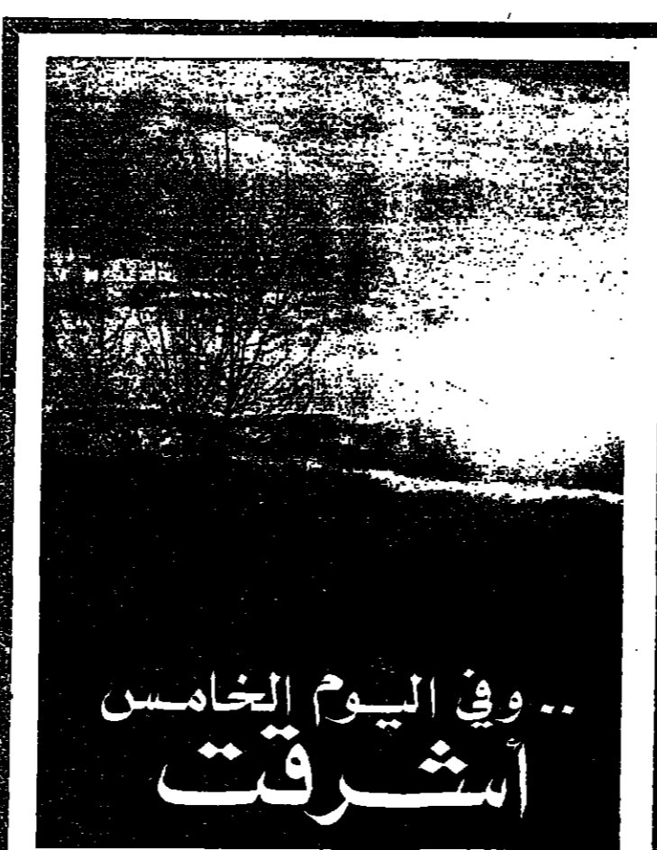
.. وفي اليوم الخامس اشرفت

رفع وزراء خارجية دول المواجهة والمساندة اجتماعهم في الرياض مساء أمس ، وقال وزير الخارجية السعودي الأمير سعود الفيصل أنهم سيستأنفونها اليوم . وقالت انباء ان هناك مقترحات لتوسيع إطار اللقاء بحيث تضم له دول أخرى بينها الجزائر . وبدأ المؤتمر أعماله أمس ، بعدما مهدت له مصر وسوريا باتصالات هاتفية بين الرئيسين السادات وال Assad . وقد حضر المؤتمر السيد عبد الحليم خدام وزير الخارجية السوري ، والسيد اسماعيل فهمي وزير خارجية مصر الذي عاد في المساء إلى القاهرة . كما حضره أيضا السيد مضر بدران رئيس وزراء الأردن ووزير الخارجية ، والسيد سيف بن عبد الفتاح وزير الدولة للشؤون الخارجية في دولة الإمارات ، والسيد صباح الاحمد وزير خارجية الكويت ، ووزير خارجية البحرين ، وود منظمة التحرير . وقال الامير سعود الفيصل بعدد